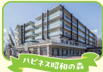
ハピネス昭和の森

東京都の多摩エリア中部に位置し、自然に囲まれたみどり豊かな街です。新宿駅までは電車で約40分、気軽に通うことができます。「住みよさランキング2023」においては、全国812の市区の中で、総合評価15位・快適度2位という高評価を得ています。