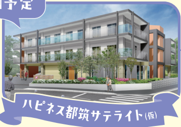
ハピネス都筑サテライト (仮)